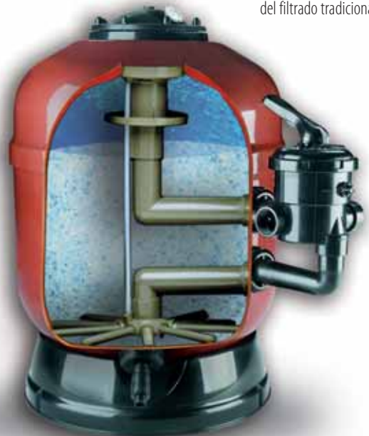
Ilustración didáctica realizada con ordenador

Desaparecen los problemas del filtrado tradicional